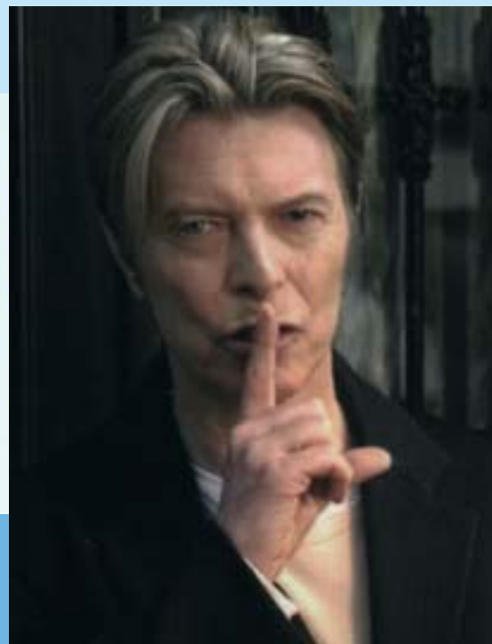
1993 : Campagne Publicis 2003 : Campagne avec David Bowie