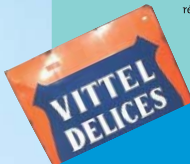
Déclinaison engagée au cours des années 1950.