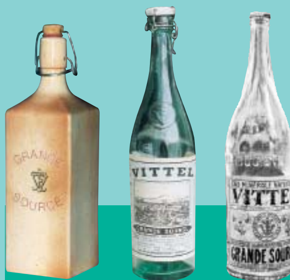
bouteille en grès