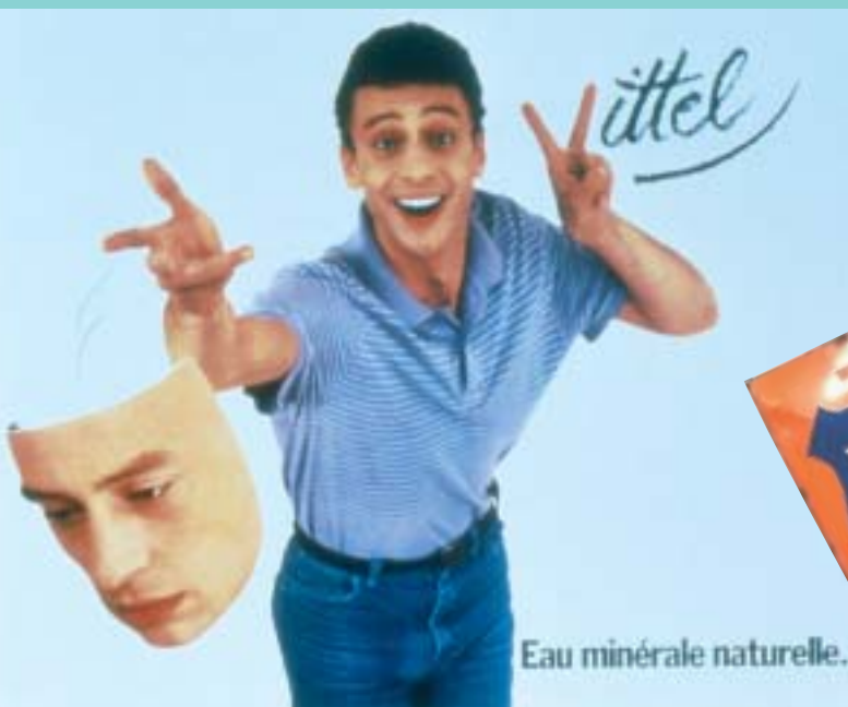
La célèbre campagne du V et du masque durant les années 1970 et 1980.

Le premier million de bouteilles est fêté en juin 1898, l'année où le verre remplace le grès.