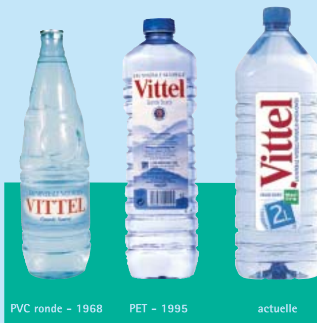
PVC ronde - 1968

3 - 23,5 millions de cols Grande Source et Hepar en 1925, 40 millions en 1930, puis conséquence de la crise économique et de la concurrence des prix, 21 millions en 1939.