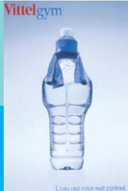
Campagne publicitaire 2002