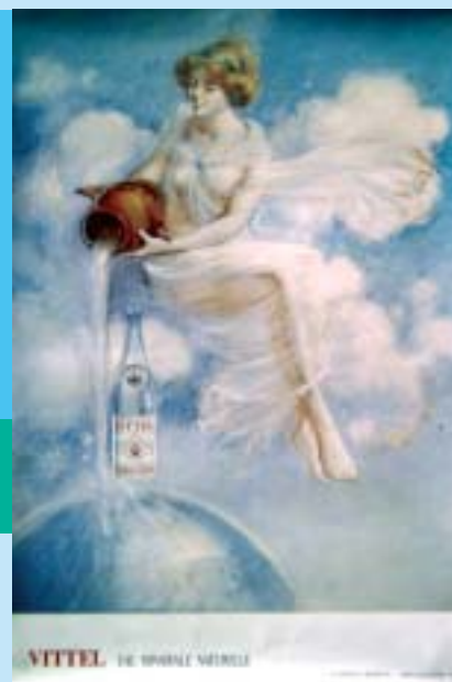
Le Casino - 1900 Pub Chemins de Fer de l'Est Femme à la cruche - 1930